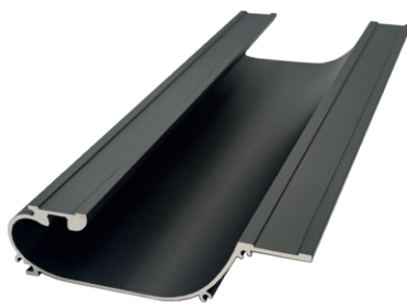
Ergonomické zapuštěné madlo s LED lištou