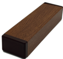
Hliníková ozdobná lišta